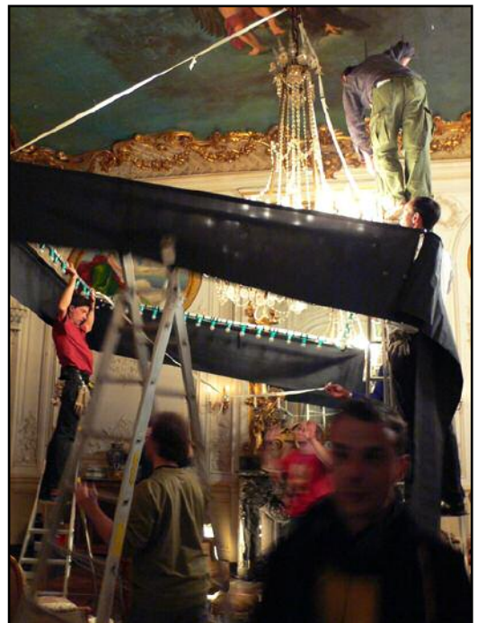
Installation d'un cadre en aluminium, tournage d' Une vieille maîtresse de Catherine Breillat

Comme je ne pouvais rien accrocher, ne pas toucher aux murs, et qu'en plus tout se voyait dans le miroir, j'avais une sorte de petite grue sans contre poids avec une perche sur laquelle nous accrochions 4 ou 6 boules chinoises. Les bougies étaient des bougies double mèche et j'avais installé sur la table deux petits tubes, genre Kino, mais ce sont des tubes que l'on installe dans les cuisines, qui ont la même température de couleur que les bougies. J'ai rajouté une gélatine magenta pour couper le vert.