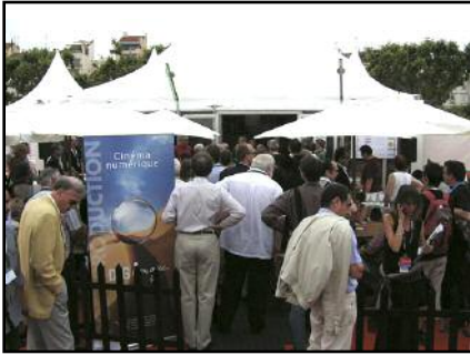
Affluence au cocktail Digimage lors du Rendez-vous de midi de la CST